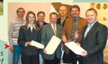
Haus des Steins Euerdorf