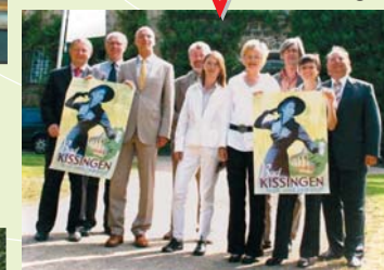
Weltbad Bad Kissingen