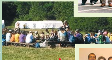
Jugendzeltplätze in Rhön-Grabfeld