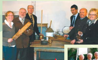
Hof zum Anfassen Fladungen